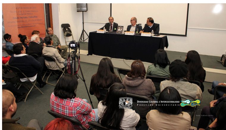
Presentación del libro: Tabasco: Una visión antropológica e histórica 18 de febrero 2016, xxxvii Feria Internacional del Libro Palacio de Minería, Salón de Firmas