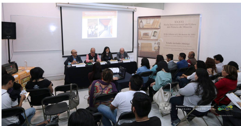
Presentación del libro: Identities in process of construction. Reflections on the auto-identification of the Totonac students of the Intercultural University of Espinal, Veracruz, Mexico 19 de febrero 2015, XXXVI Feria Internacional del Libro Palacio de Minería. Salón el Caballito