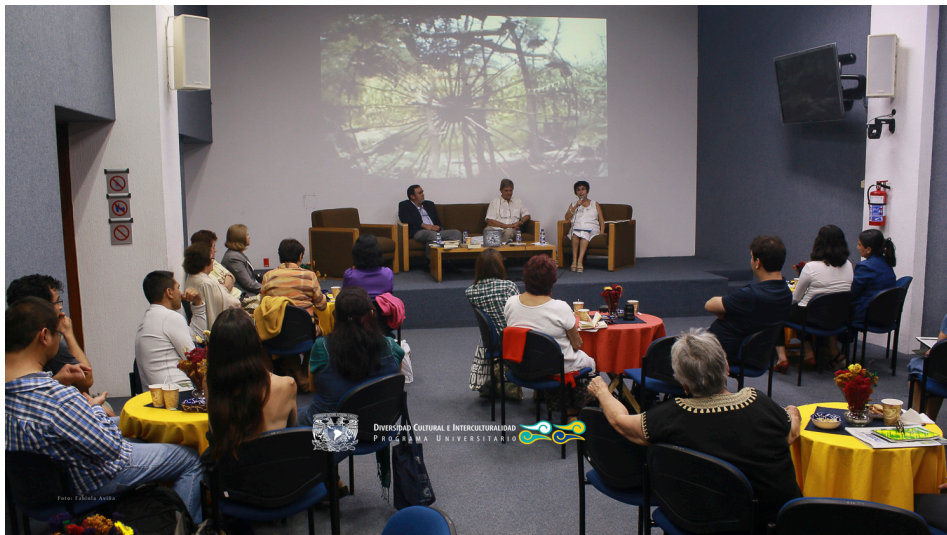
Viernes de lectura presentación del libro: Las Norias en México 06 de mayo 2016, Casa de las Humanidades