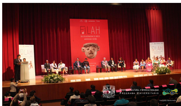
IV Encuentro del Libro Intercultural y en Lenguas Indígenas , 26 de septiembre 2014, xxvii Feria del Libro de Antropología e Historia, Auditorio Fray Bernardino de Sahagún, Museo Nacional de Antropología e Historia