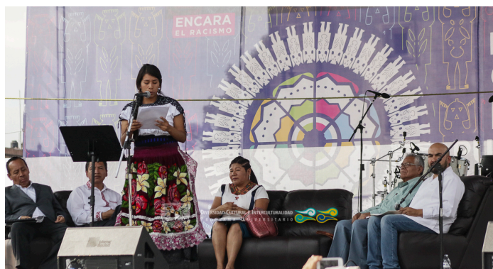
Recital de poesía en Lenguas Indígenas III Fiesta de las culturas Indígenas de la CDMX