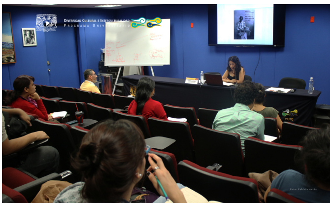
Curso de Especialización en Estudios Afroamericanos 01 de diciembre 2015, PUIC UNAM, Auditorio Arturo Warman

asistir al módulo Las Culturas Afroamericanas: Interculturalidad y Otredad. En el periodo del informe el curso se enfocó en el estudio y análisis de las culturas afroamericanas existentes en las diversas regiones de América Latina; en el análisis de los aspectos económicos que hicieron posible el arribo de población de origen africano al Nuevo Mundo, desde la mirada del comercio transpacífico; en las herencias africanas y afrodescendientes que conforman la diversidad cultural y la interculturalidad, así como en los procesos económicos, sociales e ideológicos que han establecido una relación entre las sociedades atlánticas; culturas afroamericanas, interculturalidad y otredad; las sociedades afroamericanas: metodologías y análisis.