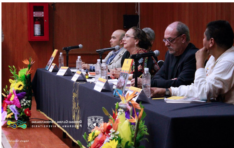
Presentación del libro: Etnografía intercultural del Sistema de Becas para Estudiantes Indígenas de la Universidad Nacional Autónoma de México (2004 – 2011) 29 de agosto 2014, Facultad de Filosofía y Letras UNAM, Aula Magna