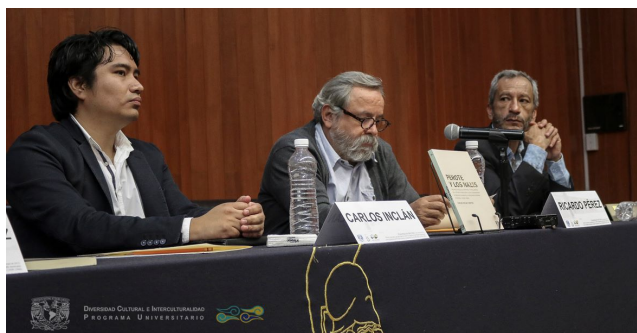
Presentación del libro: Perote y los Nazis. Las políticas de control y vigilancia del Estado mexicano a los ciudadanos alemanes durante la Segunda Guerra Mundial 1939-1946 08 de mayo 2015, Facultad de Filosofía y Letras, UNAM, Aula Magna