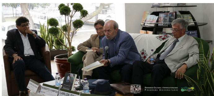
Presentación del libro: Nadie nos puede arrebatar nuestro conocimiento. Proceso de legalización de las medicinas indígenas tradicionales de Bolivia y México 22 de mayo 2015, X Feria del libro Antropológico, IIA