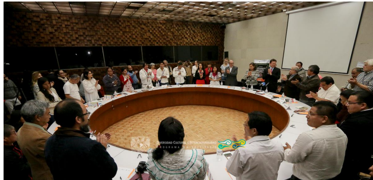
Coloquio: Pensamiento Indígena Contemporáneo 9 de agosto 2016, CCU-Tlatelolco UNAM. En co-participación con la Suprema Corte de Justicia de la Nación, el Instituto Nacional de Lenguas Indígenas y la Escuela Nacional de Antropología e Historia