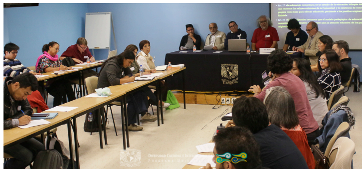
Segundo Seminario de Investigación Universidades Interculturales en México. Balance de una década En co-participación con la Universidad Veracruzana y el CEAS