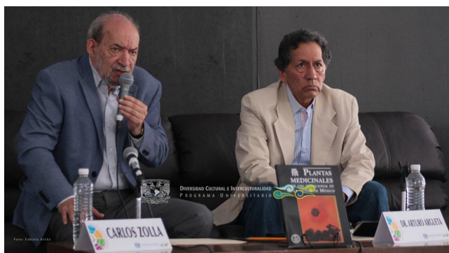
Presentación del libro: Plantas Medicinales de uso tradicional en la Ciudad de México 27 de agosto 2015, II Fiesta de las Culturas Indígenas de la CDMX, Zócalo