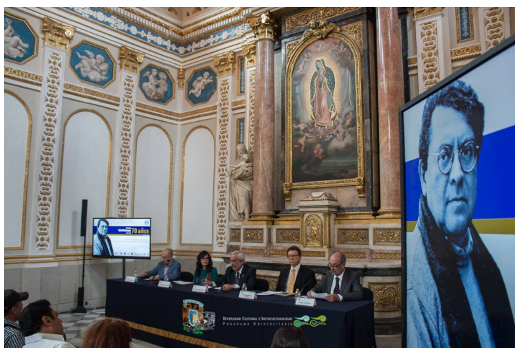
Inauguración de las “Jornadas Carlos Montemayor” Homenaje a Carlos Montemayor 70 Años In Memoriam 12 de junio 2017, Antigua Capilla del Palacio de Minería, UNAM