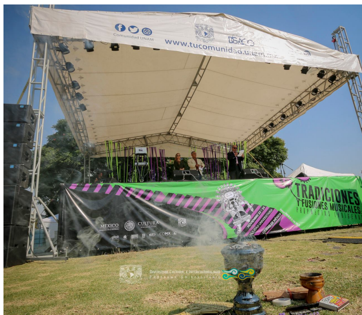
Tradiciones y Fusiones Musicales: Propuestas indígenas 22 de noviembre 2017, las Islas de Ciudad Universitaria, UNAM, en co-participación con la Dirección General de Atención a la Comunidad y con la Dirección General de Culturas Populares, Indígenas y Urbanas