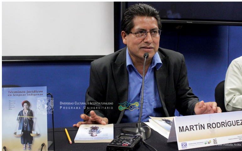
Presentación: Términos Jurídicos en Lenguas Indígenas 24 de abril 2014, PUIC UNAM, Auditorio Arturo Warman