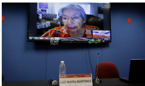
Curso de Divulgación “Afroamérica. La Tercera Raíz” 28 de noviembre 2016, PUIC UNAM, Auditorio Arturo Warman