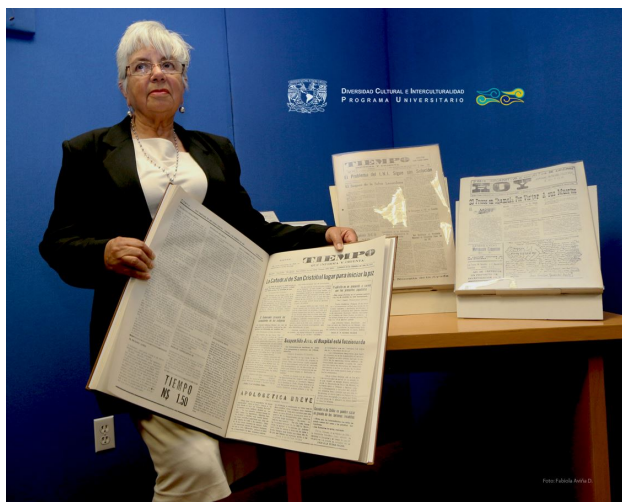
Presentación Hemerográfica: El Tiempo, Hoy y Foja Coleta 06 de febrero 2015, PUIC UNAM, Auditorio Arturo Warman