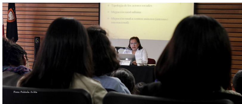
V Simposio los Mexicanos que nos dio el Mundo 20 de marzo 2014, Facultad de Derecho, UNAM, Auditorio Gabino Fraga