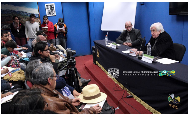
Cátedra Guillermo Bonfil: Los racismos son eternos 10 de marzo 2016, PUIC UNAM, Auditorio Arturo Warman