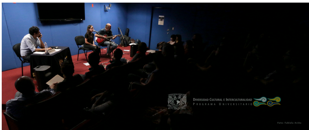
Poesía y música desde La Otra Banda