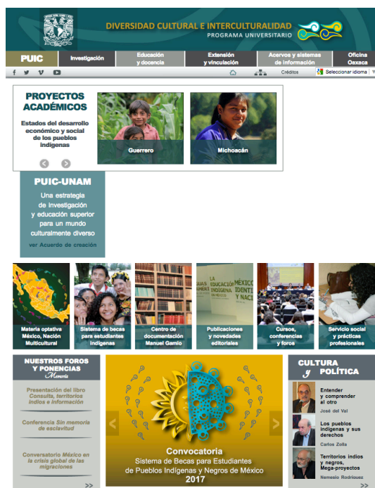
Desarrollo y difusión de los acervos del PUIC

Uno de los logros de este periodo ha sido la adquisición del inmueble que permitirá crear las instalaciones de la Biblioteca “Manuel Gamio”, que reunirá uno de los acervos bibliográficos y documentales más importantes sobre los pueblos indígenas de América.