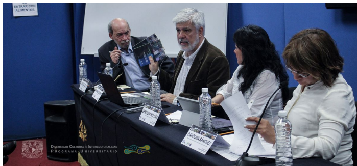
Seminario Permanente Migración Indígena En coordinación con el Instituto de Investigaciones Económicas de la UNAM