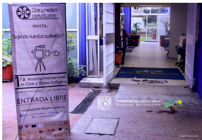
Muestra Internacional de Cine y Video Indígena “Tejiendo nuestra audiovisión” 21 de agosto 2014, PUIC UNAM, Auditorio Arturo Warman