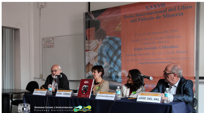
Presentación del libro: Festival Oaxaca Negra 18 de febrero 2016, xxxvii Feria Internacional del Libro Palacio de Minería, Auditorio Sotero Prieto