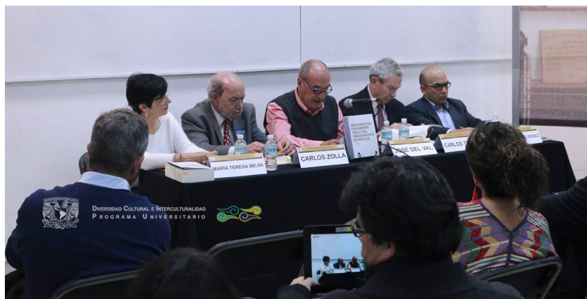
Presentación del libro: Documents Fundamental of Indigenism in Mexico 19 de febrero 2015, XXXVI Feria Internacional del Libro Palacio de Minería, Salón el Caballito