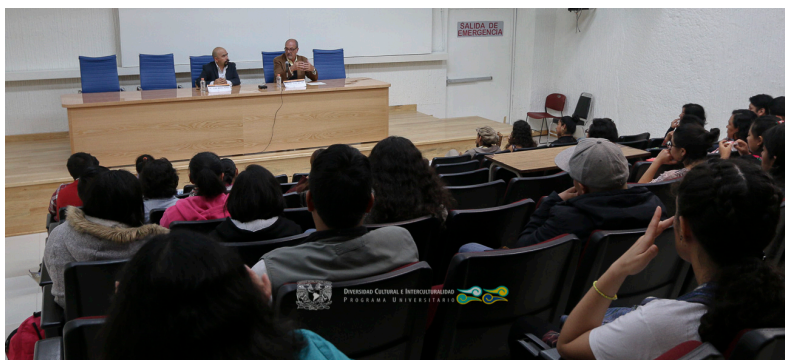
V Seminario de Radio y Comunicación Indígena 05 de septiembre 2017, FCPYS UNAM, Auditorio Fernando Benítez