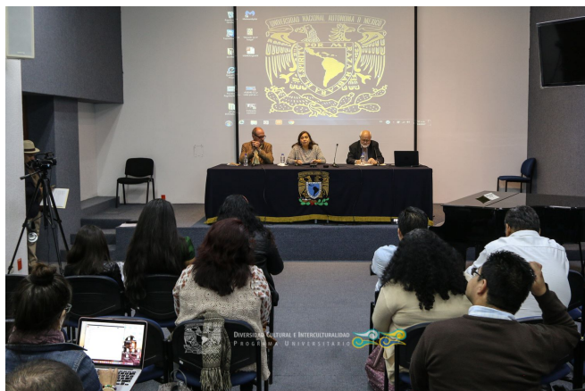
Coloquio Nacional: “¿Cómo queremos llamarnos? Horizonte Censo INEGI 2020” 17 de abril 2017, Casa de las Humanidades