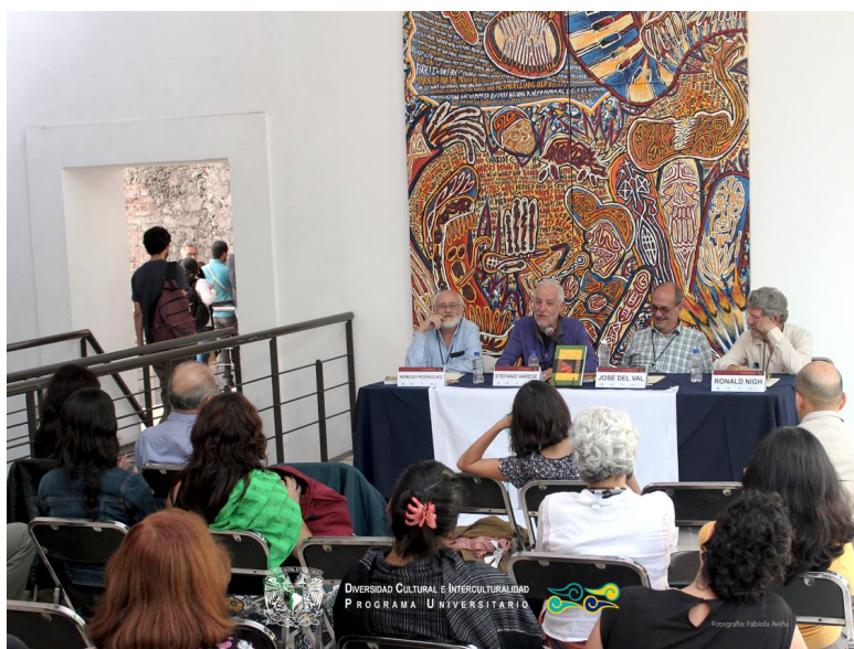
Presentación del libro: Selva Vida, de la destrucción de la Amazonía al paradigma de la regeneración 25 de septiembre 2014, III Congreso Mexicano de Antropología Social y Etnología, Centro Cultural del México Contemporáneo, Sala François Lartigue