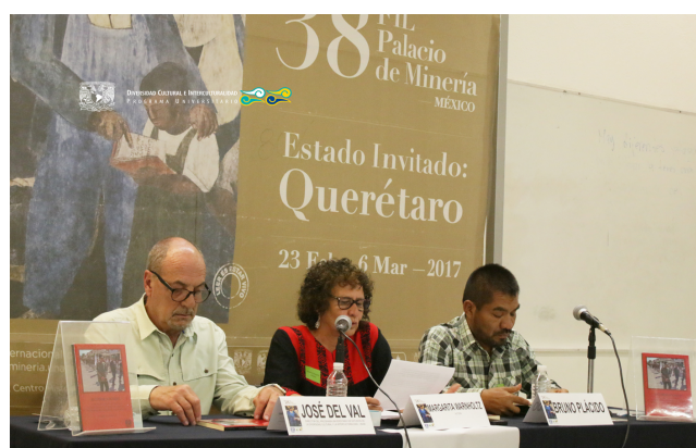
Presentación del libro: Recuperar la dignidad. Historia de la Unión de Pueblos y Organizaciones del Estado de Guerrero, Movimiento por el Desarrollo y la Paz Social 23 de febrero 2017, XXXVIII Feria Internacional del Libro Palacio de Minería, Salón Cuatro