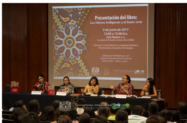
Presentación del libro: Las líderes indígenas y el buen vivir 09 de junio 2017, Facultad de Filosofía y Letras UNAM, Aula Magna