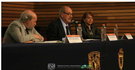
I Seminario Universitario: La familia en las sociedades contemporáneas 21 de noviembre 2017, Facultad de Derecho UNAM, auditorio Dr. Eduardo García Máynez

Fue celebrado el 21 de noviembre de 2017 en el Auditorio Dr. Eduardo García Máynez de la Facultad de Derecho de la UNAM y tuvo como objetivo reflexionar y analizar los retos teóricos y metodológicos que impone el mundo contemporáneo al estudio de la familia, reuniendo a destacados especialistas en los ámbitos nacional e internacional de las disciplinas demográficas y jurídicas. El antecedente de este seminario fue la realización de dos simposios sobre el tema de familia realizados en 2015 y 2016.